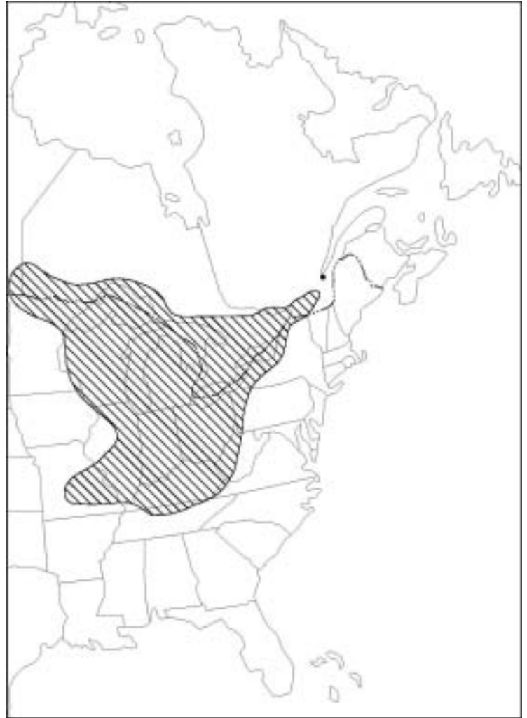
Figure 1. Répartition nord-américaine de la lamproie du nord

La lamproie du nord est une espèce propre à l'Amérique du Nord (figure 1). Au Canada, elle se retrouve dans le bassin hydrographique de la baie d'Hudson, au Manitoba, et dans le bassin hydrographique des Grands Lacs et du fleuve Saint-Laurent, en Ontario et au Québec (Lanteigne 1992). Elle est par ailleurs absente du lac Ontario, ou y serait très rare. Aux États-Unis, elle se rencontre dans le bassin du Mississippi depuis le Wisconsin jusqu'à l'Ohio et vers le sud jusqu'au Kentucky (Vladykov et Kott 1979b). Il existe aussi une population disjointe sur les hautes terres des Ozarks au Missouri (Pflieger 1997). Elle est présente dans les états suivants : Illinois, Indiana, Kentucky, Michigan, Minnesota, Missouri, New York, Ohio, Pennsylvanie, Vermont, Virginie de l'Ouest et Wisconsin.